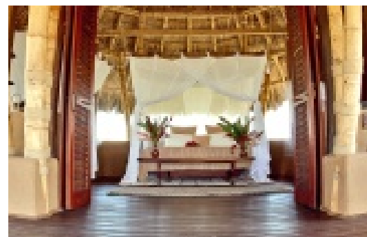
Paja, barro, madera, conchas y cascarnes. El arquitecto Michel Lewis utilizó materiales naturales para las primeras tres casas del hotel.