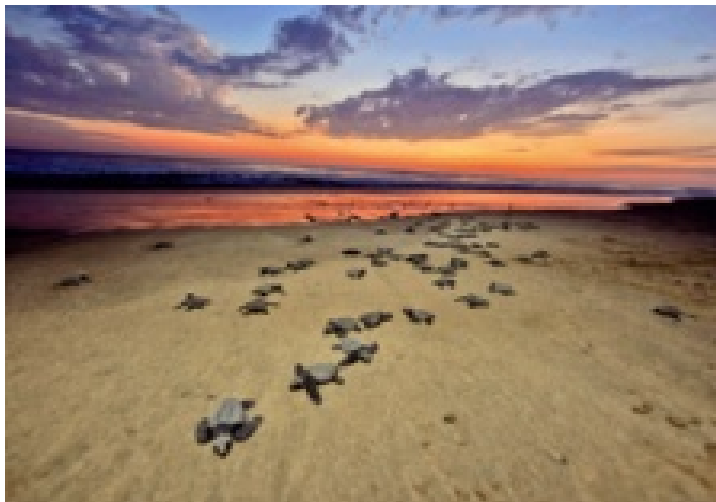
Si nacen crías en el santuario y tienes la fortuna de ser testigo, puedes participar en su liberación.

Una vez bienvenido con un vaso de agua fresca, del sabor de la mejor fruta del día, se dan las reglas básicas: tirar papel en el bote de basura, no en el excusado; revisar que no haya alacranes en la habitación con una lámpara de