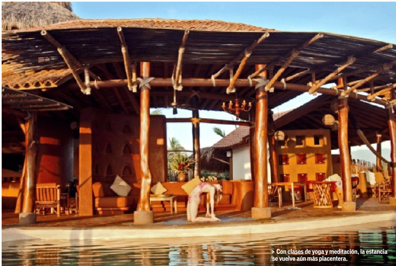
Con clases de yoga y meditación, la estancia se vuelve aún más placentera.